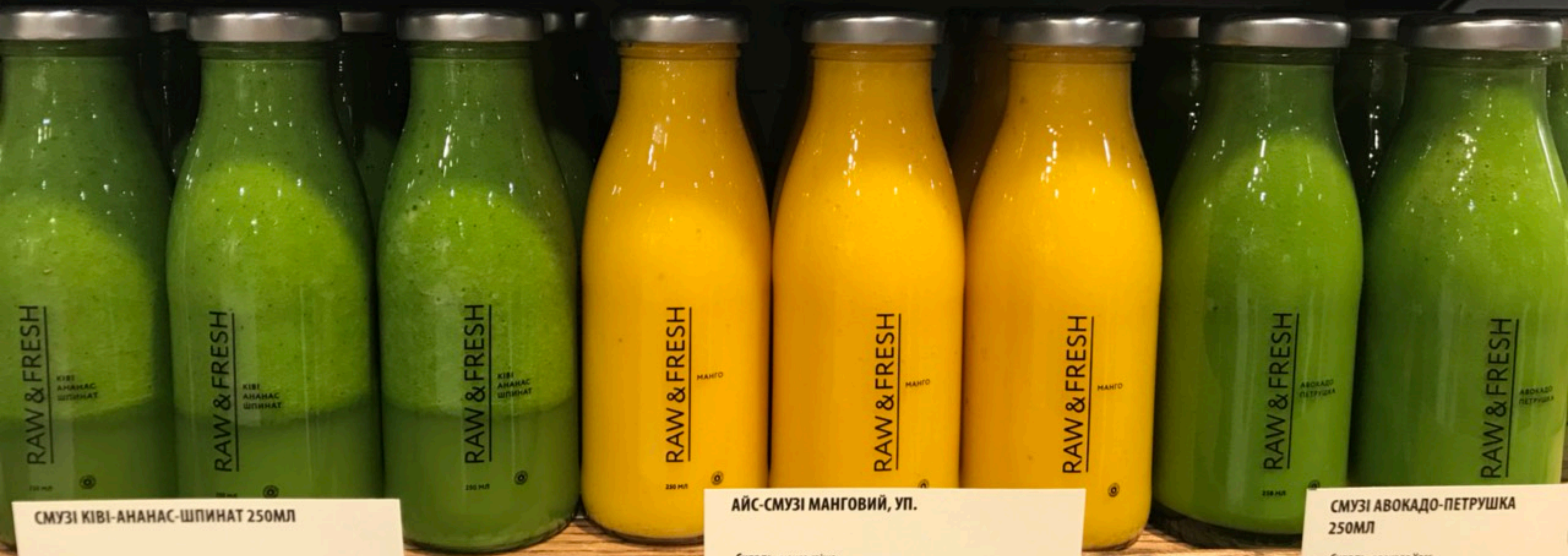
СМУЗІ КІВІ-АНАНАС-ШПИНАТ 250МЛ Склад: ківі, листя шпинату, яблуко свіже, ананас свіжий